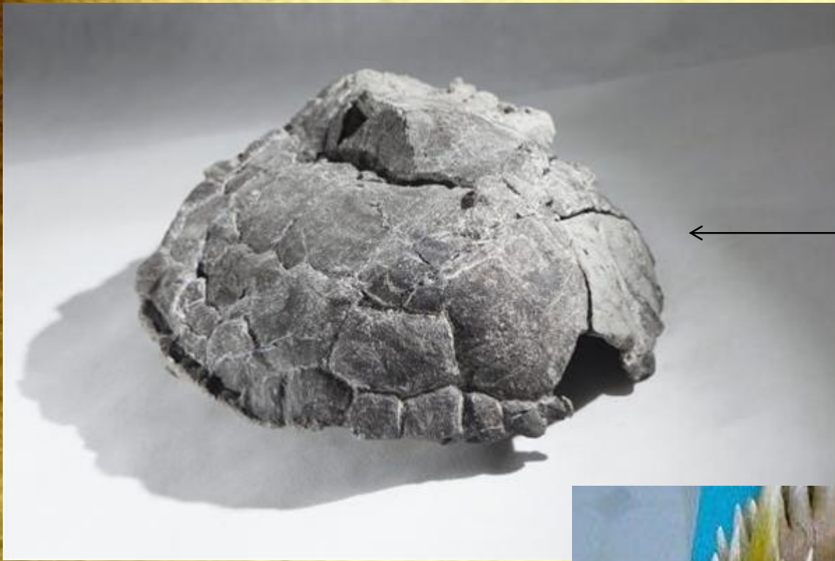
← Skorupa żółwia